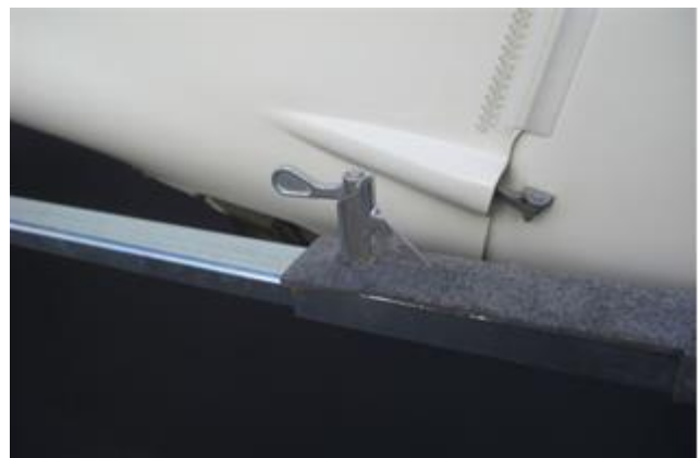
...und die Schlepstange verriegelt sich dabei automatisch.

Anlegen des Spornkullers und ankuppeln des Flugzeuges mühelos, ohne anheben und ohne Schieben!