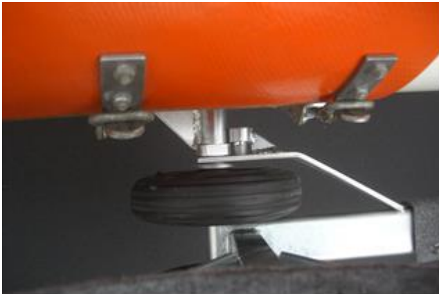
Jetzt nach hinten legen...