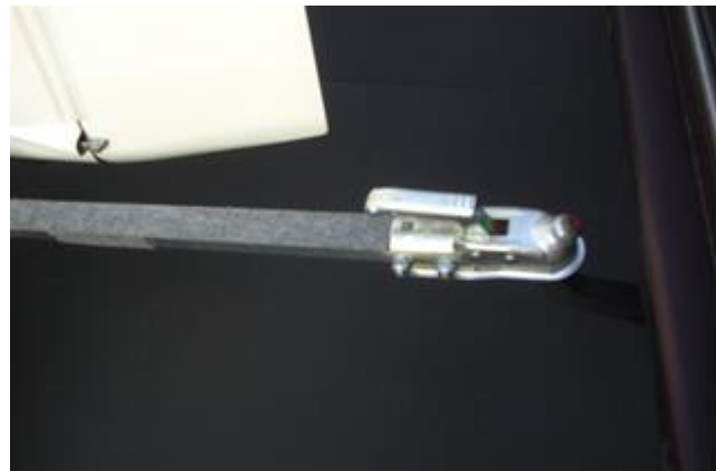
...die Schlepstange ankuppeln...