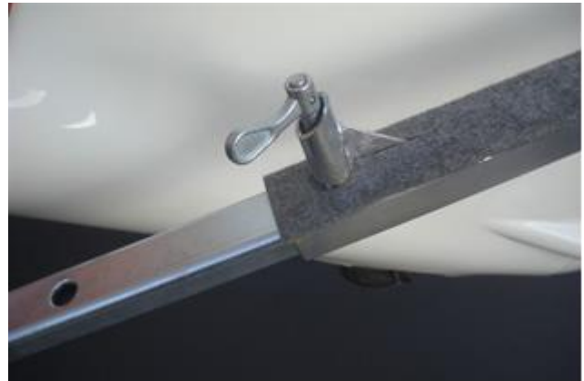
... den Federriegel lösen, die Stange etwas ausziehen, aber den Federriegel nach vorne, stehen lassen.